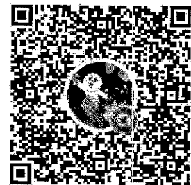
QR CODE Line ประสานงานโครงการฯ